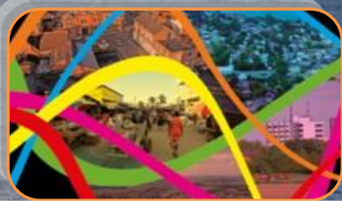
14 juin 2015 à Grand-Quevilly Fêtes des 5 villes jumelles

La lettre de liaison et des nouvelles – N° 1