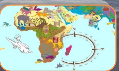
25 septembre 2015 Création du Collectif Diasporas Solidaires