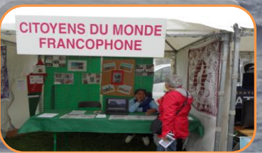
12 septembre 2015 à Grand-Quevilly Forum des associations